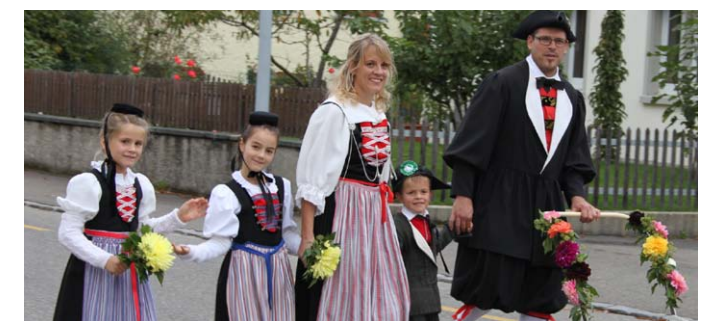
Samstag/Sonntag, 4./5. und 11./12. Oktober 2014

1 Nachtbus am Samstag mit Zuschlag. NFB 77 Richtung: Schaffhausen, Bahnhof