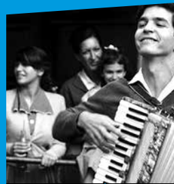
MARINA CINÉMA ♦