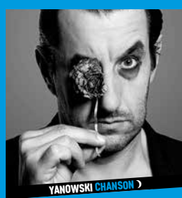
YANOWSKI CHANSON >