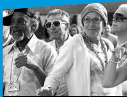
SONG FOR MARION CINÉMA ♦