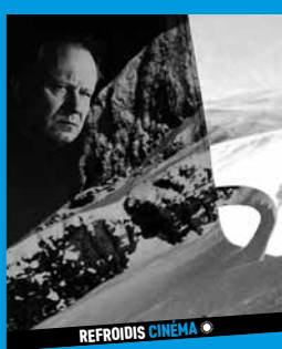
REFROIDIS CINÉMA ♦