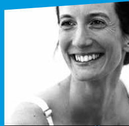
BOLL & ROCHE DANSE-THÉÂTRE >