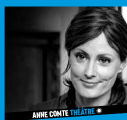
ANNE COMTE THÉÂTRE ♦