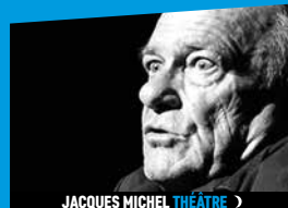
JACQUES MICHEL THÉÂTRE >