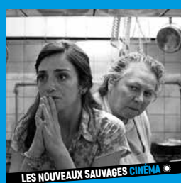
LES NOUVEAUX SAUVAGES CINÉMA ♦