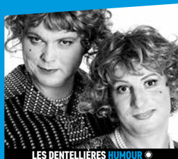
LES DENTELLIÈRES HUMOUR ♦