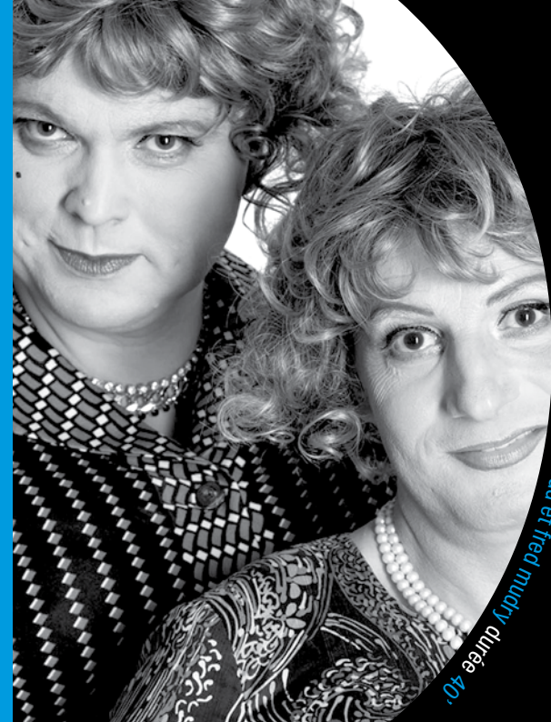
Jeu pierre mitsud et fred muddy durée 40'