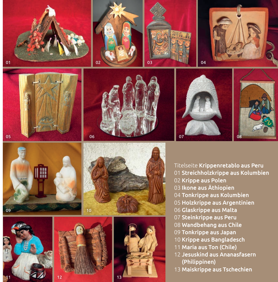
Titelseite Krippenretablo aus Peru 01 Streichholzkrippe aus Kolumbien 02 Krippe aus Polen 03 Ikone aus Äthiopien 04 Tonkrippe aus Kolumbien 05 Holzkrippe aus Argentinien 06 Glaskrippe aus Malta 07 Steinkrippe aus Peru 08 Wandbehang aus Chile 09 Tonkrippe aus Japan 10 Krippe aus Bangladesch 11 Maria aus Ton (Chile) 12 Jesuskind aus Ananasfasern (Philippinen) 13 Maiskrippe aus Tschechien

Hinweis Wie wäre es mit einem Mittagessen im Restaurant Neu-Schönstatt? Vor Anmeldung: T +41 81 511 02 00.