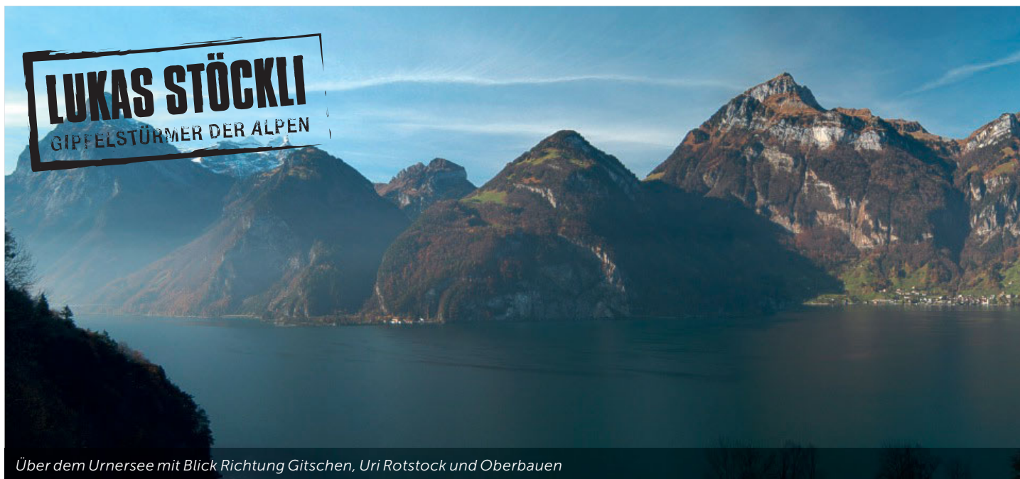
Über dem Urnersee mit Blick Richtung Gitschen, Uri Rotstock und Oberbauen