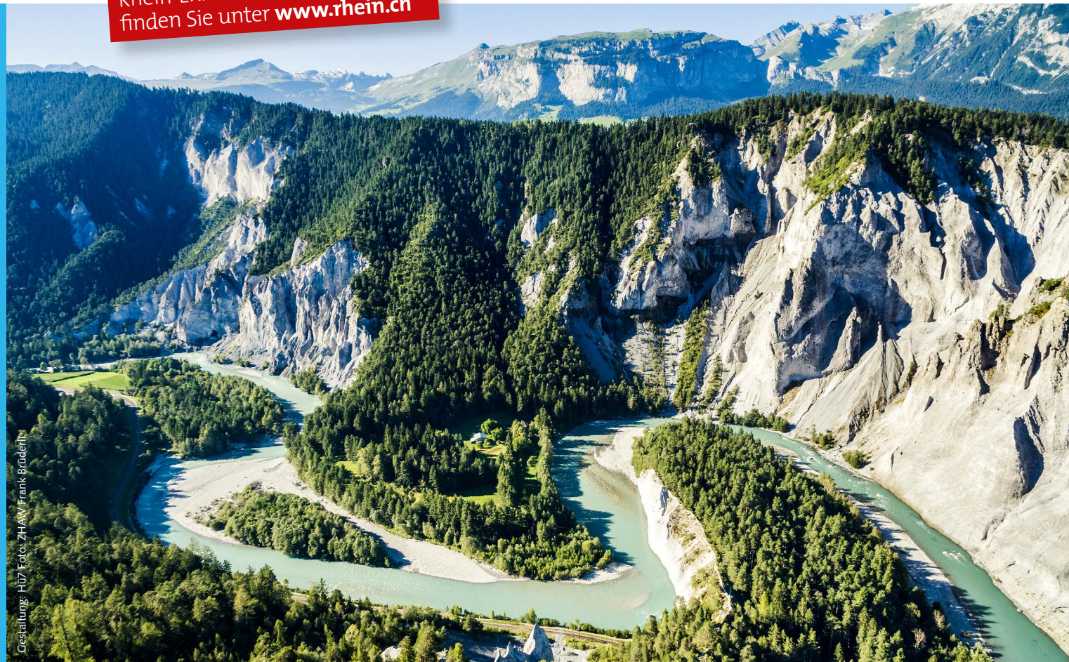
Gestaltung: HUZ