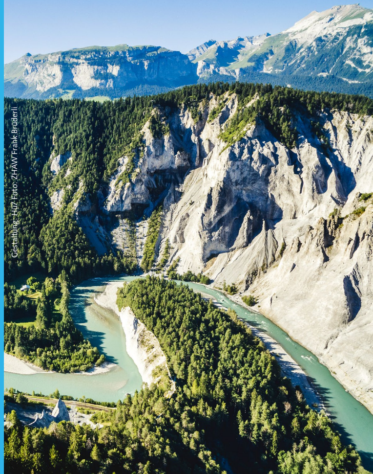
Gestaltung: H17

Für die Anreise zum jeweiligen Treffpunkt haben Sie die Möglichkeit, ein Bahnticket «Einfach für Retour» zu kaufen. Sie lösen ein Einfach-Billet für die Anreise, stempeln dieses beim Exkursionsleiter, bei der Exkursionsleiterin ab, und schon ist es auch für die Rückfahrt gültig. Das Angebot gilt für alle RheinExkursionen ab allen Einstiegsorten in Graubünden für Fahrten mit der Rhätischen Bahn und dem Postauto: www.fahrtziel-natur.ch/de/reiseangebote